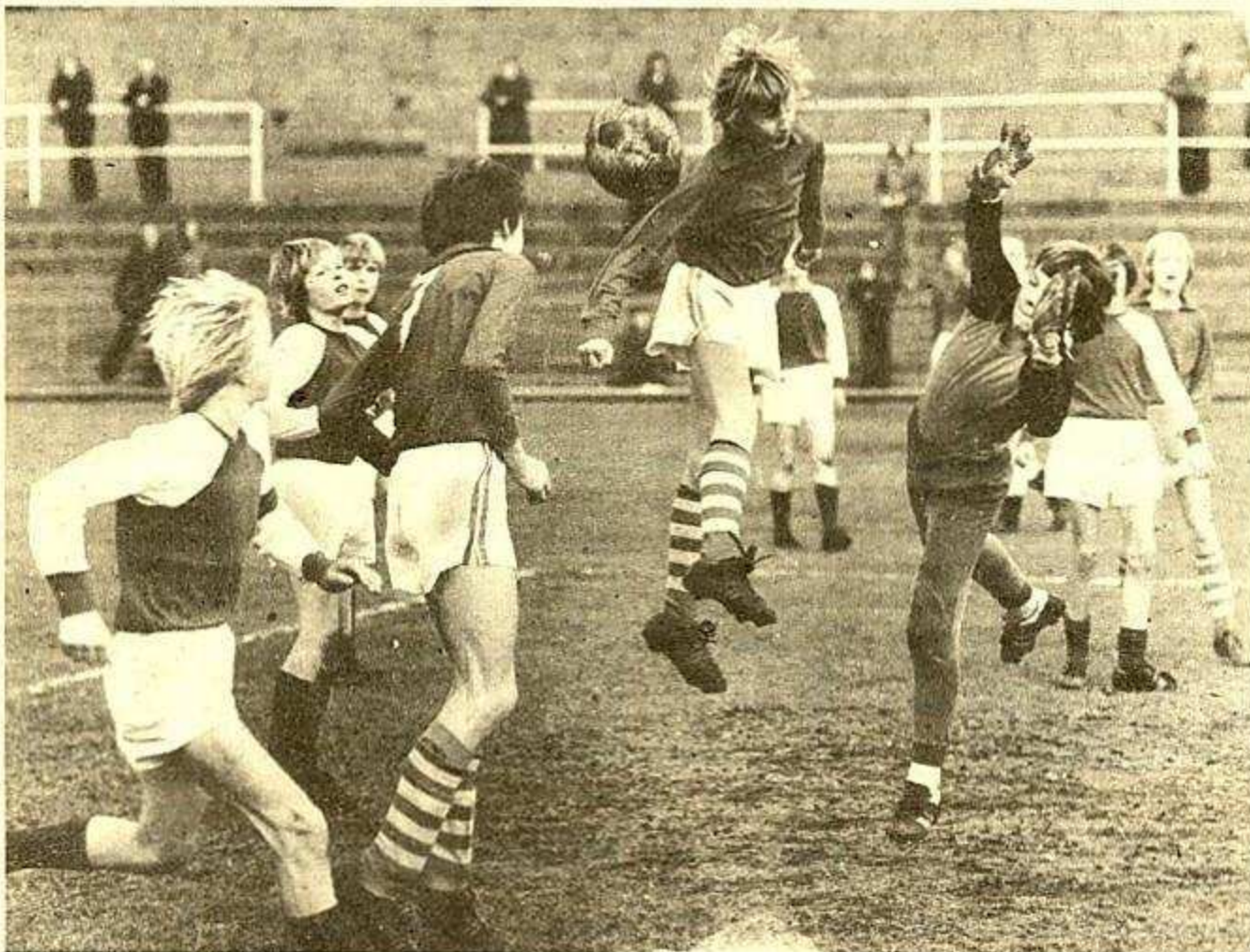
Die Spartakiadevorbereitungen haben in allen Bezirken begonnen. Dazu gehören natürlich auch Vergleiche der Bezirksauswahlmannschaften. Berlins Schüler setzten sich kürzlich vor dem FDGB-Pokalspiel 1. FC Union-Stahl Riesa gegen Neubrandenburg mit 3:1 durch.