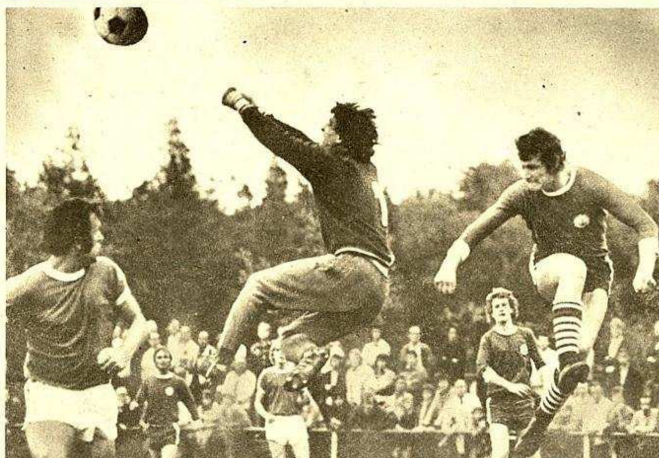
Bevor Schiffahrt-Hafen-Angreifer Looitz (rechts) an das Leder kommen kann, hat es Wismars Torsteher Teß mit den Fäusten abgewehrt. 1:1 trennten sich beide Mannschaften in Rostock.